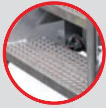
Revêtement antidérapant Non-slip surface

Un moyen sûr et efficace d'accéder à vos bennes en toute sécurité A sure and effective way to access your skips in total safety