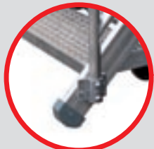
Patins chaussettes Booted feet