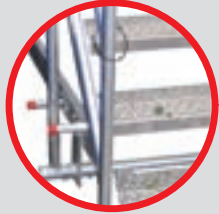
Levier pour commande des roues Lever to control the wheels