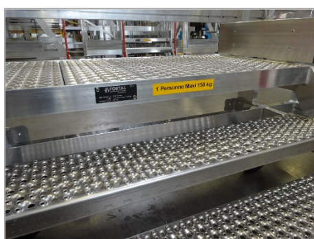
Revêtement palier et marches caillebotis antidérapant