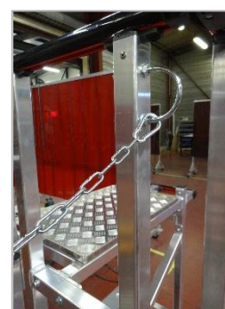
Chaînette en partie arrière du palier