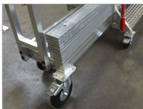
Contrepoids et roues