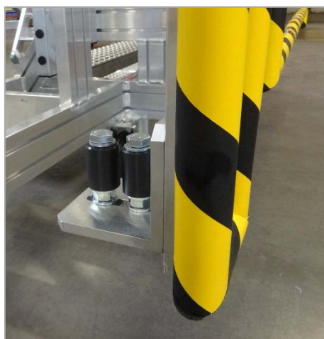
Principe du guidage par rail de l'ensemble sur le bord de la fosse