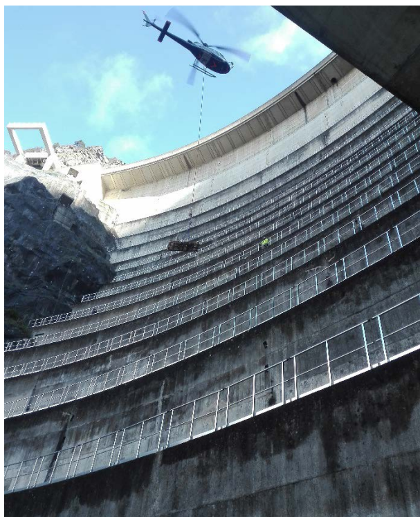
Les garde-corps ont été livrés sur les différents niveaux de gradins par hélicoptère.