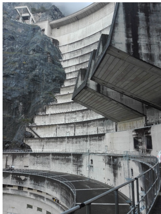
Les éléments de 2 mètres permettent d'épouser parfaitement l'arrondi des gradins.