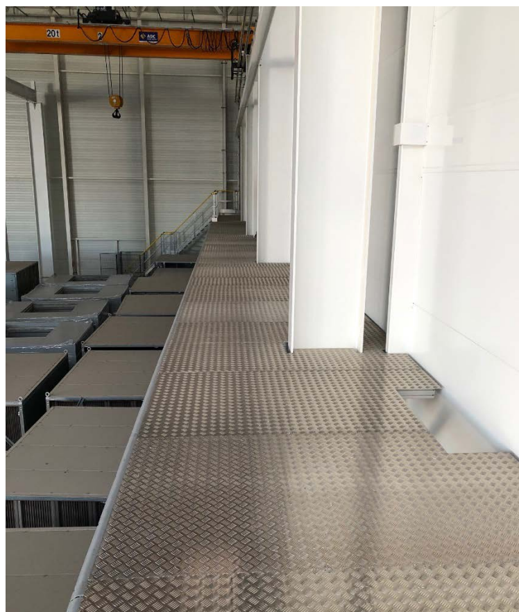
Longueur totale du palier : 29 785 mm Revêtement : tôle alu larmée épaisseur 4.4 mm Portillons de sécurité intermédiaires (non représentés sur la photo).