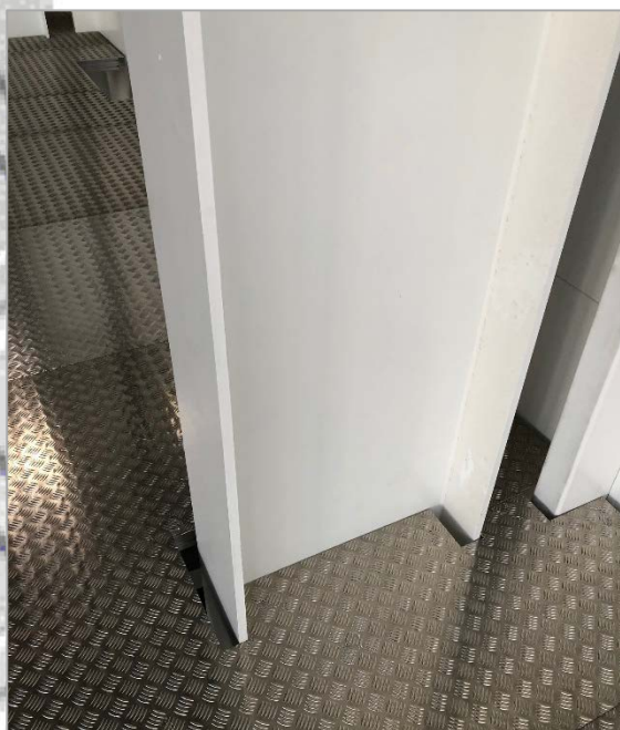
Une découpe parfaite de la tôle alu larmée lors de l'installation par l'équipe de pose.