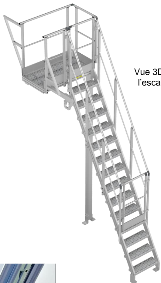
Vue 3D de l'escalier