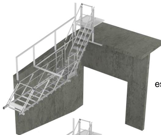
Vue 3D de la structure avec escalier en partie basse relevé