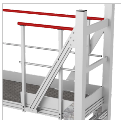
Garde-corps sur toute la longueur coté avant du véhicule et garde-corps avec ouverture coté arrière du véhicule