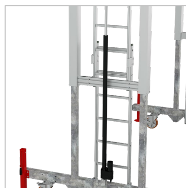
Echelle réglable en hauteur par vérins électriques de 2000 à 3200 mm