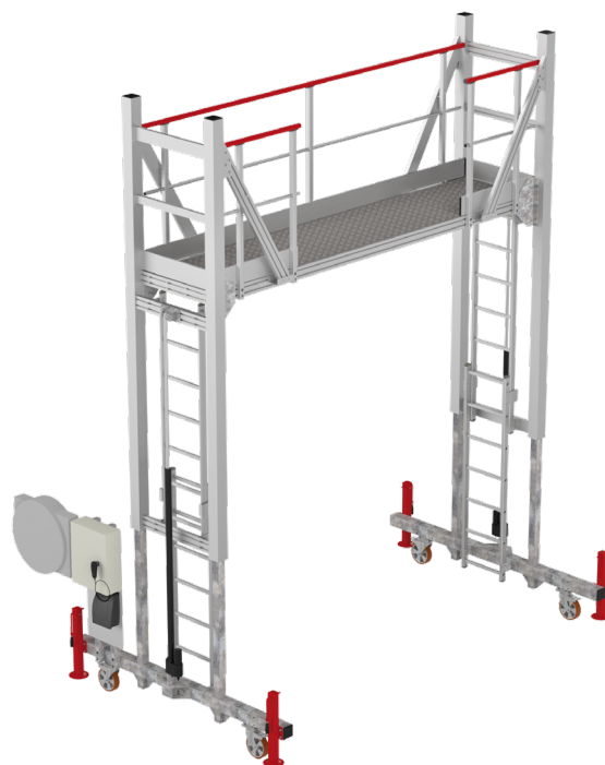
Vue 3D de la plateforme d'accès