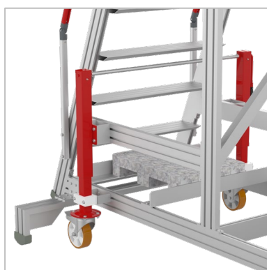
Pieds et roues avant réglables en hauteur