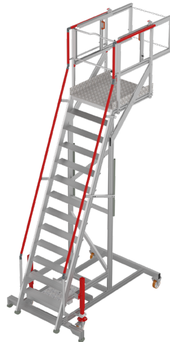
Vue 3D avant de l'escabeau