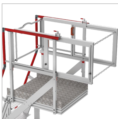
Garde-corps coulissants en longueur