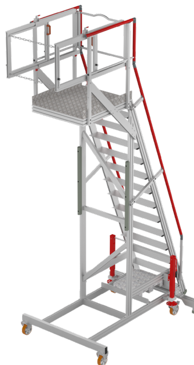
Vue 3D arrière de l'escabeau