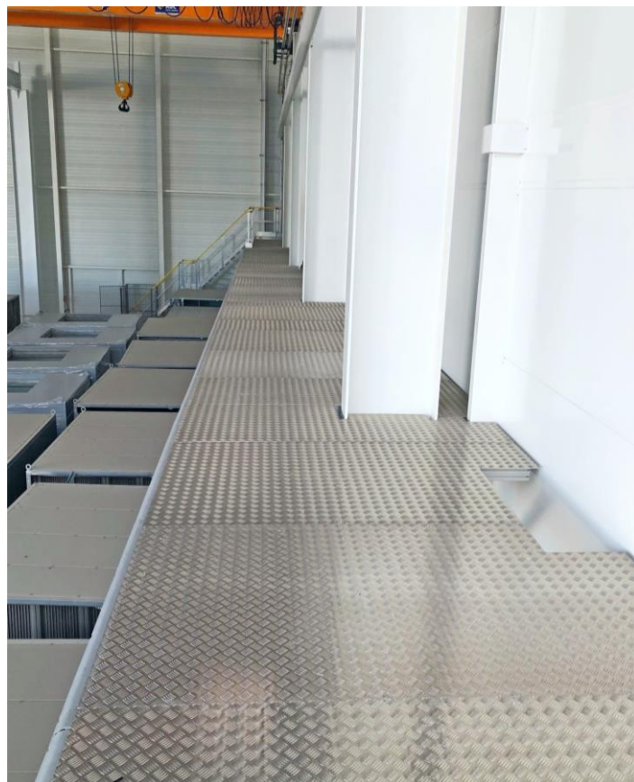
Gesamtlänge der Plattform: 29 785 mm Beschichtung: 4.4 mm dickes Tränenblech Zwischenschutztüren (nicht auf dem Bild dargestellt).